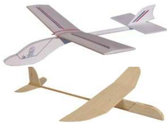
Avions Propulsion musculaire