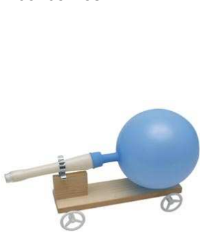
Véhicule fusée Propulsion à réaction

Voici trouverez dans cette annexe, les différentes réalisations que nous pouvons proposer. Bien sûr cette liste n'est en aucun cas exhaustive et nous pouvons proposer d'autres choses après discussion avec les enfants concernés.