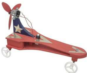
Voiture de course Propulsion électrique