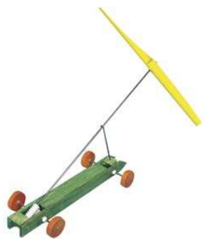
Véhicule éolien Propulsion éolienne