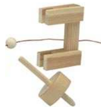
Toupie de traction