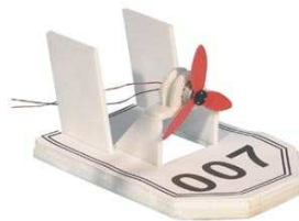
Aéroglesseur Propulsion électrique